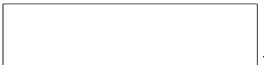
Схема границы эксплуатационной ответственности

Организация водопроводно- канализационного хозяйства