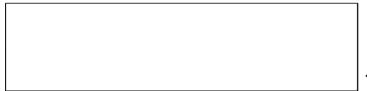
Схема границы эксплуатационной ответственности

(указать адрес, наименование объектов и оборудования, по которым определяется граница балансовой принадлежности исполнителя и заявителя)